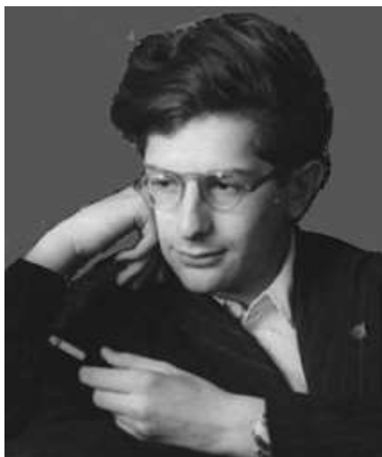
Студент химического факультета Ташкентского университета